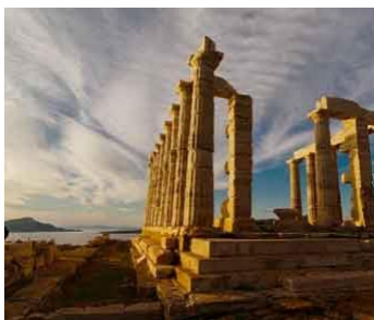
Nella foto: Capo Sunion

Prima colazione e partenza per Capo Sunion (o Sunio) con pranzo incluso in un ristorante della costa. Visita al sito archeologico del Tempio di Poseidone , il Dio del mare. Secondo il mito sarebbe il luogo dal quale Egeo, re di Atene, si sarebbe gettato nel mare al quale venne dato il suo nome (mar Egeo). Il primo riferimento letterario è nell’Odissea di Omero: doppiando il capo, muore il nocchiero della nave di Menelao, e sulla spiaggia sottostante vengono tenuti i suoi funerali. Questo punto strategico gode di una vista spettacolare sul mare! Proseguimento, infine, per Atene . Arrivo e sistemazione in albergo. Cena e pernottamento.